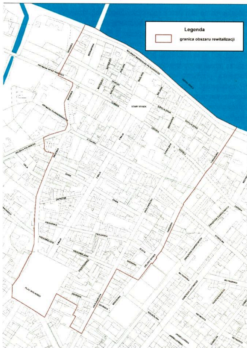
Rycina. 1. Granice obszaru rewitalizacji