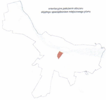
orientacyjne położenie obszaru objętego sporządzeniem miejscowego planu